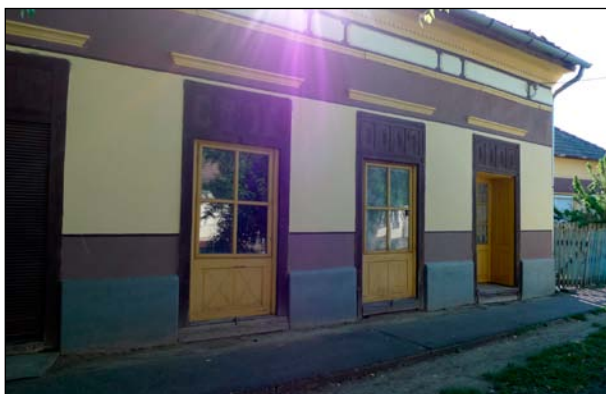
Az egykori Katz kocscsma

Milyen úton kerültek anyagok a zsidó gyűjteménybe? 2009 októberében beneveztem a Kulturális Örökség Napjára. Akkor a szakrális emlékekről volt szó. Arra gondoltam, hogy a zsidó téma