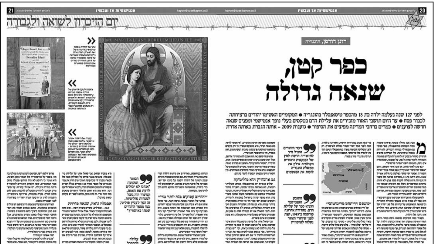
Az eredeti cikk: Magyarország az izraeli sajtóban. Primitív ikonosztás

A cikk az Israel Hayom című napilapban jelent meg 2009. április 21-én.