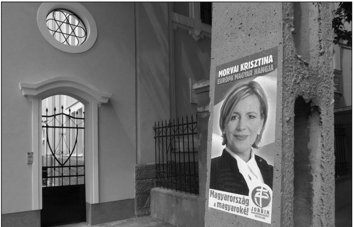
Választási plakát a Nyíregyházi Zsidó Hitközségnél. Célzott üzenet?