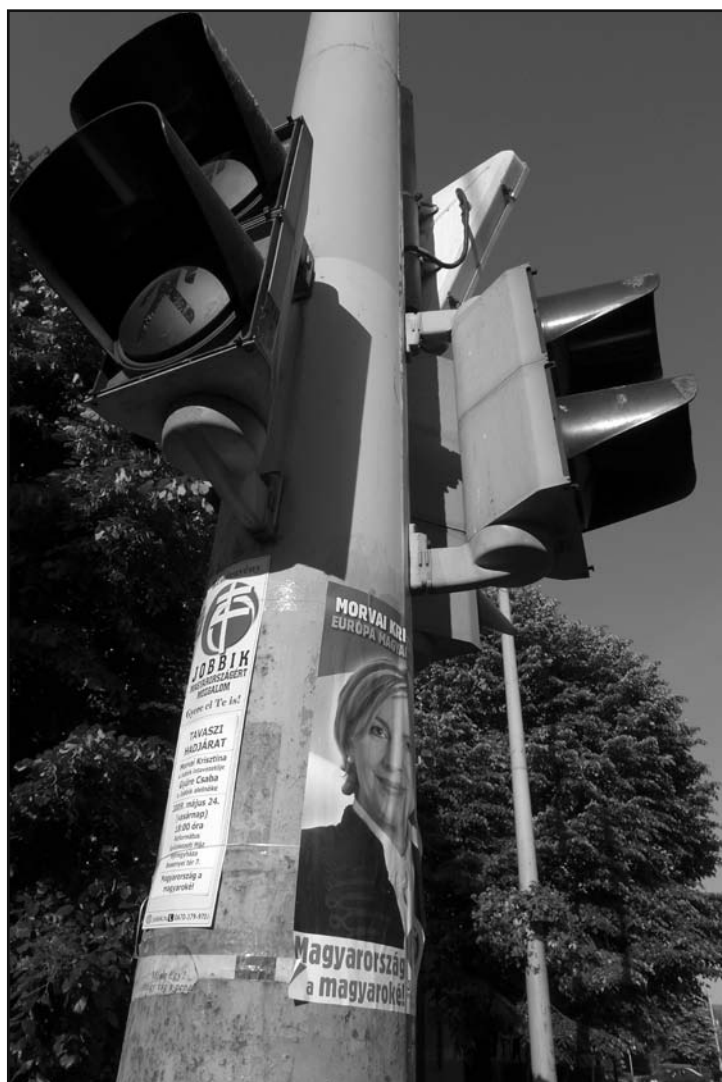
Plakát mindenhol. Vajon a társadalmi jelzőlámpák működnek?