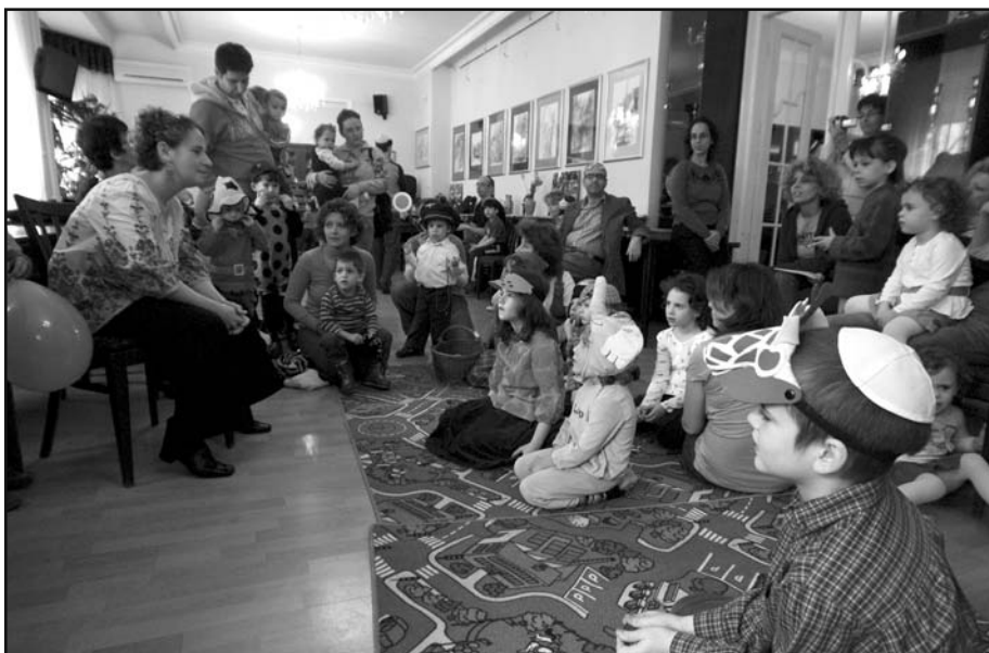
Purimi foglalkozás a Frankelben