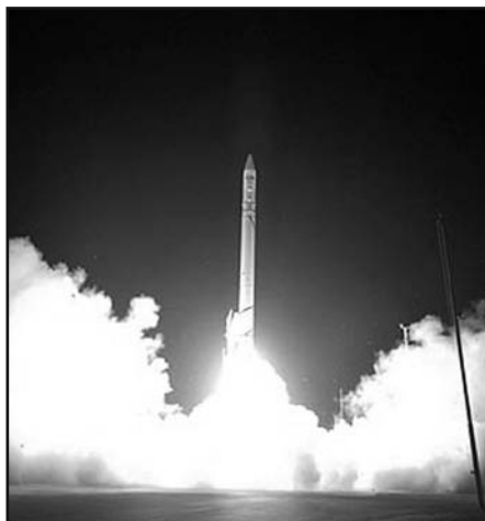
Az Ofek-7 izraeli kéműhold fellövése