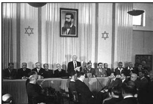
Ben Gurion kikiáltja Izrael Államát

Az alkotmány létrehozása mellett mégis sokan kardoskodtak, legtöbben pusztán a Függetlenségi Nyilatkozat szövegére hivatkozva. Az állam fennállásának 60. évfordulója közeledtével hivatalos és magánkezdeményezésre létrejött szervezetek több változatot is kidolgoztak, a javaslat megfogalmazása azonban természetesen a Kneszet alkotmányozó bizottságára tartozik. Munkájukról