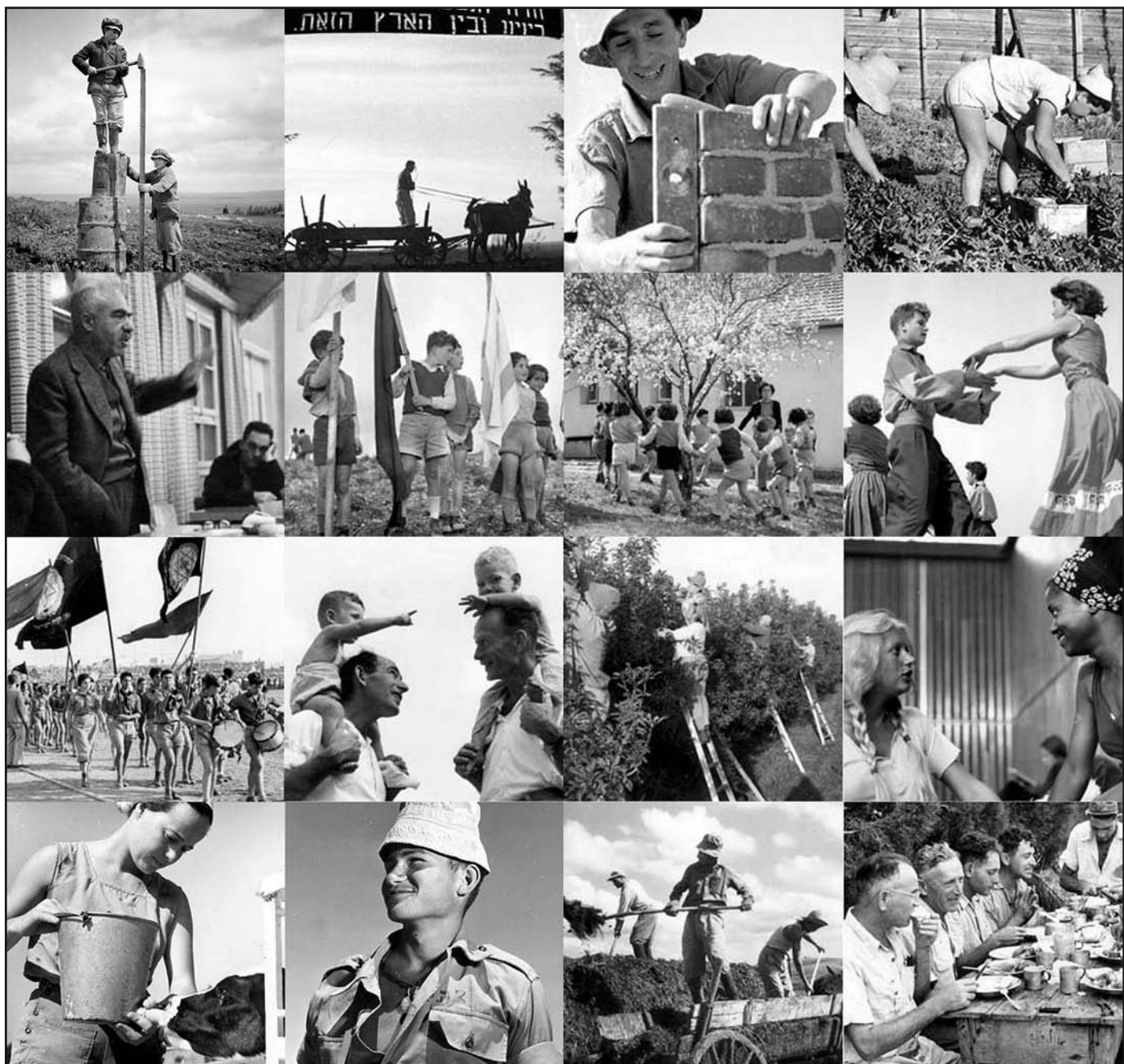
Archív felvételek az izraeli mindennapokról a XX. század derekán

Cikkeinkből: Egy közelgő születésnapra • A Soá előzményei • Az első zsidótörvény • 65 év után Dorosicsról • Megbocsátunk? • Izrael hármás fenyegetettségben • Zsidongás a Frankelben • Cél a szabadság •