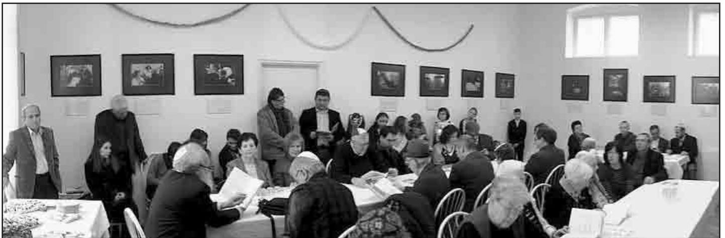
Megila olvasás.