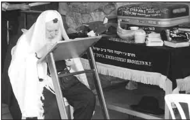
A Fal melletti alagút bejáratánál

Nem félsz – kaptam meg én is a kérdést elutazásom előtt, s hogy nem alap nélkül, bizonyította a szigorú reptéri ellenőrzés, a katonák kísérte kisiskolások látványa, a vadászpülők gyakori zúgása, a kávézők-