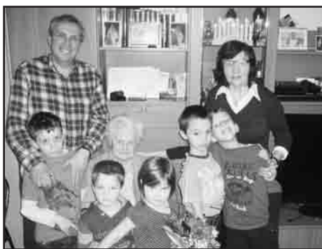
Fia, menyé és dédunokái társaságában

Egy napon bevagonírozta bennünket és elvittek Rawensbrückbe. Ez egy közbenső állomás volt, nem sokáig tartózkodtunk itt, dolgozni itt sem kellett. Enni egy kis répalevest adtak, majd néhány nap múlva újból bevagonírozta és elvit-