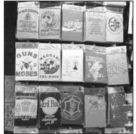
Guns N' Moses - pólófeliratként is

Honnan tetszettek jönni? Magyarországról? Nahát, otthon is megbukott a kormány (az elutazásunk előtti napon mondott le Gyurcsány)! De itt is új kormány lesz (ekkor állt össze a Likud a Liebermann-féle párttal). Na és a bácsi honnan jött? – kérdezzük mi is. Egy daltal válaszolok. Tetszenek ismerni azt, hogy „Ő volt az a zimberi, zombori szép asszony...”. Szóval a vajdasági Zomborból kerültem Pestre, majd a háború után ide. De minden évben hazamegyek. Főleg könyvekért. A szuvenir boltban kipát keresünk. Van kötött és horgolt, himzett