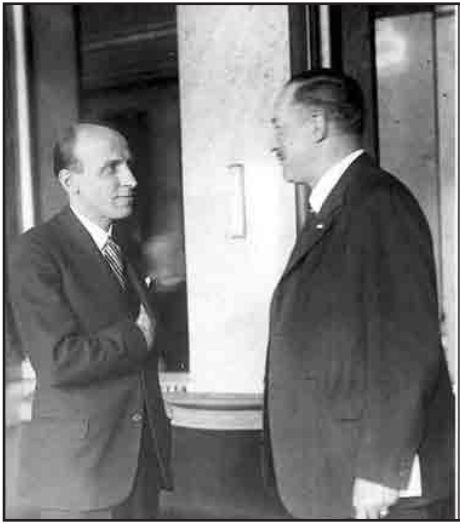
Imrédy és Darányi a Parlament folyosóján

Az 1930-as évek közepétől a náci Németország politikai és gazdasági befolyása növekedésének hatására a hazai szélsőjobb (köztük több nagy létszámú tisztii csoport) egyre határozottabban kö-