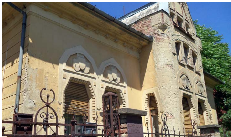
Boriska egykori Báthori utcai villája ma