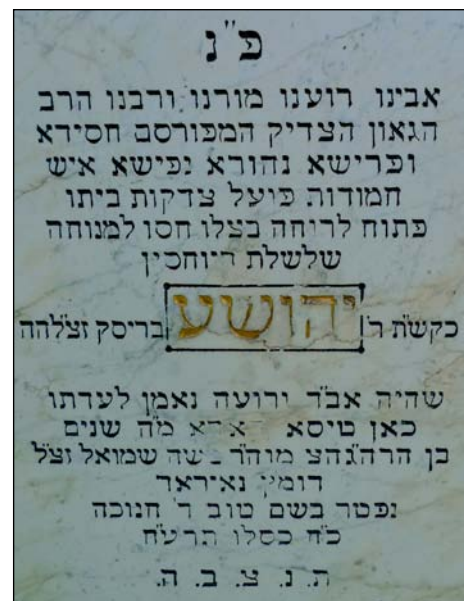
Briszk rabbi sírfelirata

idén már kétszer rendbe tette. Látszik, hogy rendszeresen gondozzák mind a két kis temetőt. A nagyobbban, ahol a rabbi is nyugszik, négy-öt, a kisebbben egy-két sírt látogatnak. Ebben az évben már két