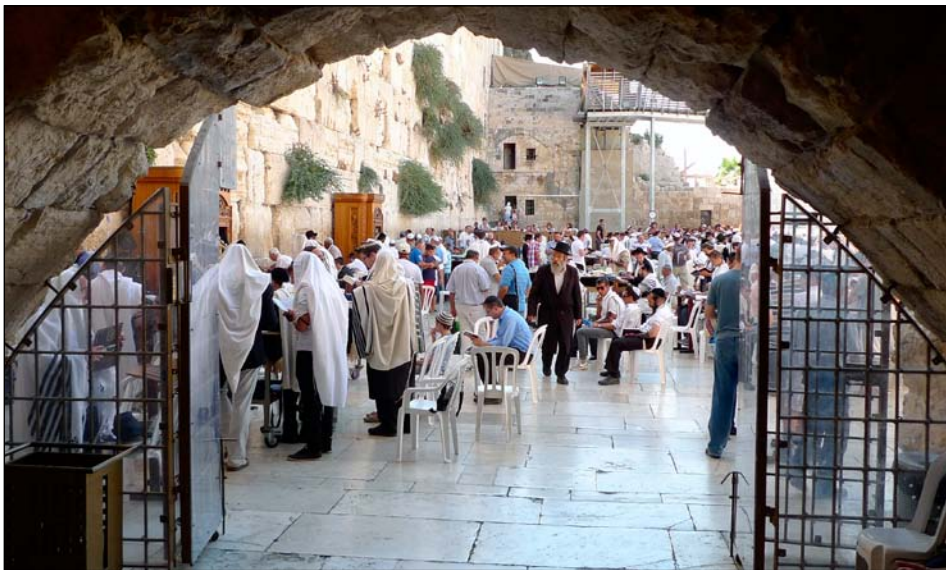
A Nyugati Fal

az i.e. 7. században. A felirat szerint: „a harmadik hadjáratom alkalmával megtámadtam Hattit (Szíria-Palesztina). Mivel Ezékiás nem hódolt be, megrohmoztam a fallal körülvett erődöket