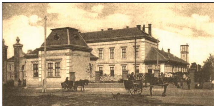
Az Erzsébet Közkórház

Nekem a sorsom úgy hozta, hogy eszmélésem óta közöm van a kórházhoz és neki énhozzám. Emlékszem, 1953 nyarán apám ügyeletes volt, mint szinte mindig. Olykor kimentünk a pár lépésre lévő kórházudvarra csizet, stiglicet fogni léppel. Pár perc múlva a csendbe belehasított a nővér kiáltása: „Gyorsan, gyorsan, jöjjön, doktor úr, megszületett a gyerek!” Ő volt a húgom. Egy másik emlék: az akkorra már 530 ágyas kórházban két orvos ügyelt. Egy műtétes és egy „telepi”. Apám a bőrgyógyászatban dolgozott, szilveszter napja volt. Reggel riasztották, menjen asszisztálni császármetszéshez. Dél körül a „ragály osztályon” gégemetszést végzett,