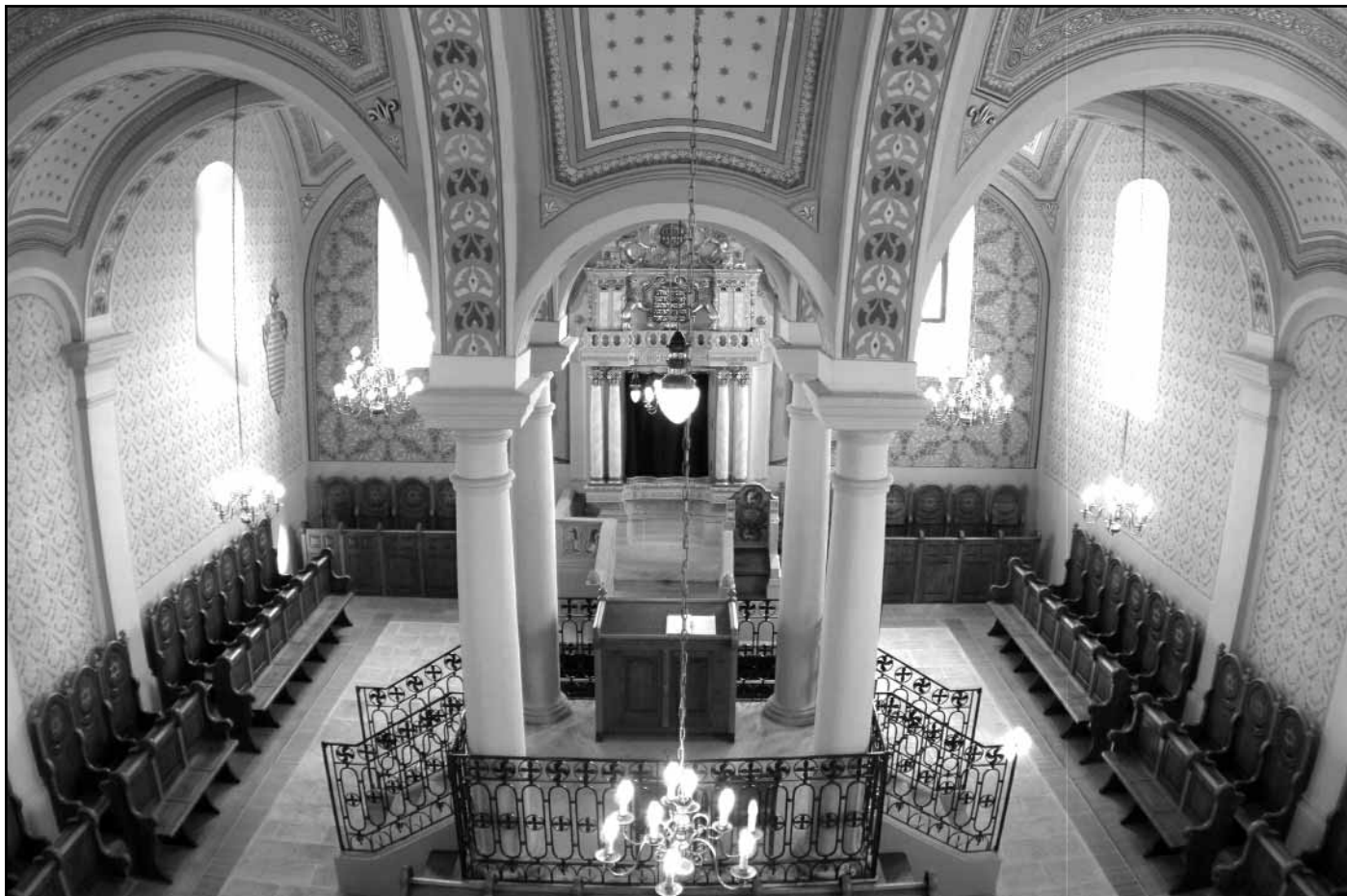
A mádi zsinagóga belső tere

A zsinagógának helyt adó ingatlan a Borsod-Abaúj-Zemplén Megyei Önkormányzat tulajdonában van, és múzeumkénti szakmai felügyeletét a miskolci Herman Ottó Múzeum látja el, de működésének gazdasági kezelése egyelőre rendezetlen. A tervek szerint ezt is a Herman Ottó Múzeum kapná meg, de erre egyelőre hivatalos felhatalmazást nem kapott az intézmény, így kifizetés még nem történt, pedig fenntartási költségek vannak, hiszen a zsinagóga és a ▶