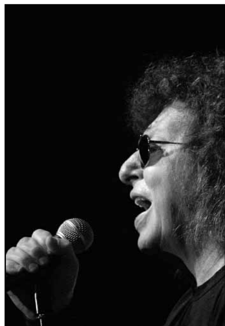
Demjén „Rózi” Ferenc

Demjén Ferenc részt vett számos holokauszt megemlékezésen, köztük jelen volt a Páva utcai Holokauszt Emlékközpont megnyitóján is azon művészek között, akik felolvasták 60 ezer holokauszt-áldozat nevét. Az énekes, basszusgitáros, szövegíró, zeneszerző, producer, lemezkiadó Demjén nyíregyházi koncertjén bizonyította: 60 évesen sem kopott meg, slágerei ma is megmozgatják a közönséget. ■