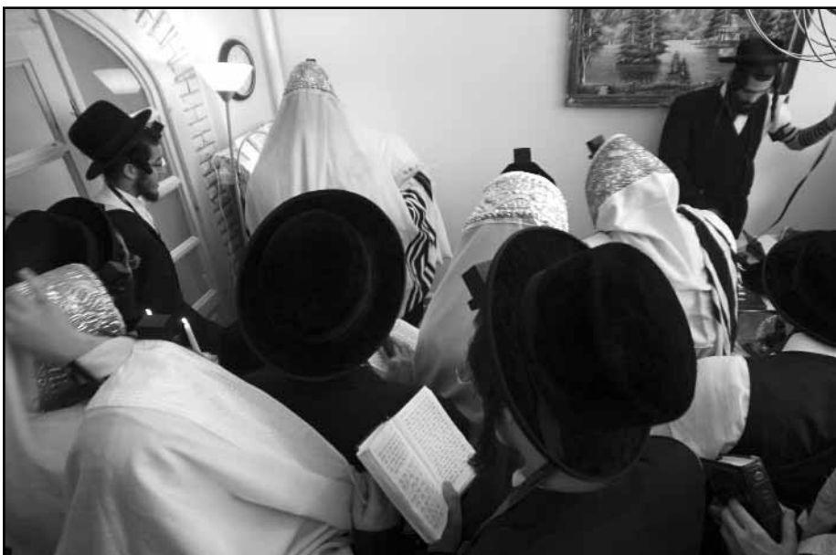
A tasher rebbe dávenol Nyírtasson hívei körében

A nevezetes nyírtassi sábeszen a kóser ellátásról a közösség tagjai saját maguk gondoskodtak. A péntek esti és a szombati közösségi rendezvényen egy, a mikvének helyt adó ház mögött felállított, többszáz fő befogadására alkalmas sátorban ünnepeltek a kanadai chászidok. A nyírtassi létesítmény egyben a Mechon Simon Alapítvány új, kelet-magyarországi központjaként is szolgál. ■