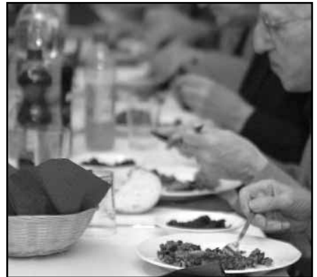
Sölösidesz (képünk illusztráció)