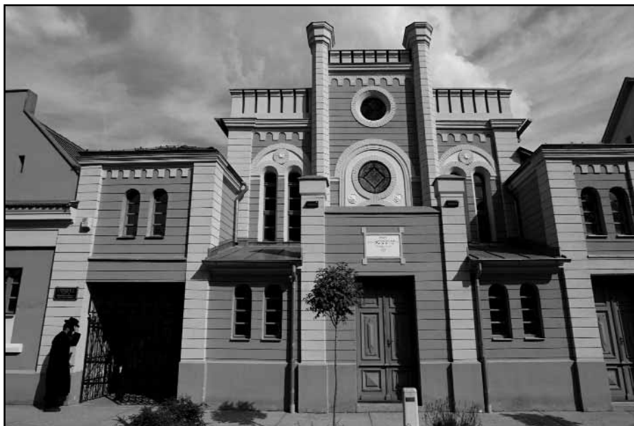
A makói zsinagóga: visszatér a zsidó élet

A közösség tagjai a rebbe sírját körbevéve Lemberger főrabbi vezetésével végig olvasták a Tehilim könyvének mind a százötven zsoltárát. A kb. kétórás imádkozást idősek, fiatalok együtt teljesítették ugyanolyan át-