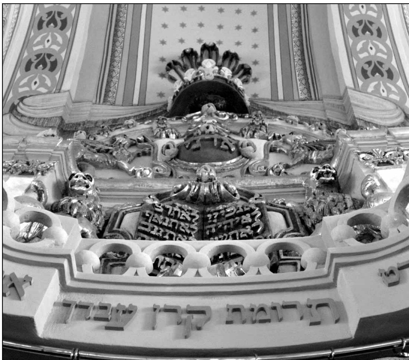
A felújított mádi zsinagóga Tóra-szekrény feletti díszítése

További cikkeink: Rózi és ami mögötte van ■ Makói zsidók világtalálkozója ■ Eseménynaptár: 65 éve történt... ■ „Észak felől támad a veszedelem...” ■ Médiaháború: Izrael az örök vesztes?