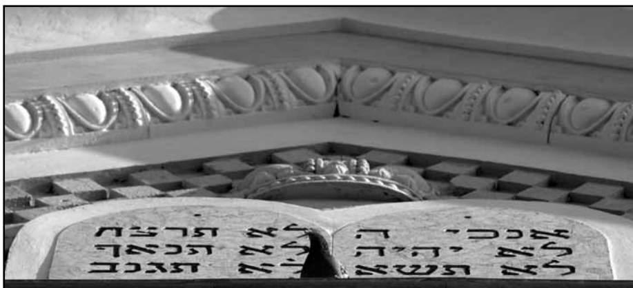
A Tízparancsolat kőtábláinak illusztrációja. Ma is hirdetjük

Mózesnek nincsen síremléke. A Tóra szerint az Ö-ökkévaló maga temette el. Az emlékének szentelt napon nem marad más, mint követni példáját a hitben, az istenfélelemben.