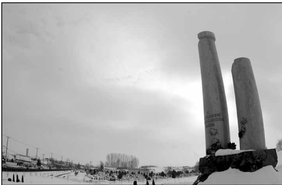
A II. Világháborús emlékmű Nagykállóban. A zsidó áldozatokra is emlékeztet

Egy névsor, amely a benne szereplők többségének csak a nevét tartalmazza. Az adatok gyűjtését a deportálásból és a munkaszolgálatból hazatérő néhány idősebb túlélő kezdeményezte még 1945-ben. A hazatértekkel összeírták elpusztított szeretteik, szomszédaik, ismerőseik nevét, majd több alkalommal és több éves egyeztetés után állt össze a sok száz főt tartalmazó lista. Az adatgyűjtők többségének a kivándorlása után az összeírás Izraelben és más országokban folytatódott, illetve került sor - az oda korábban kíván-