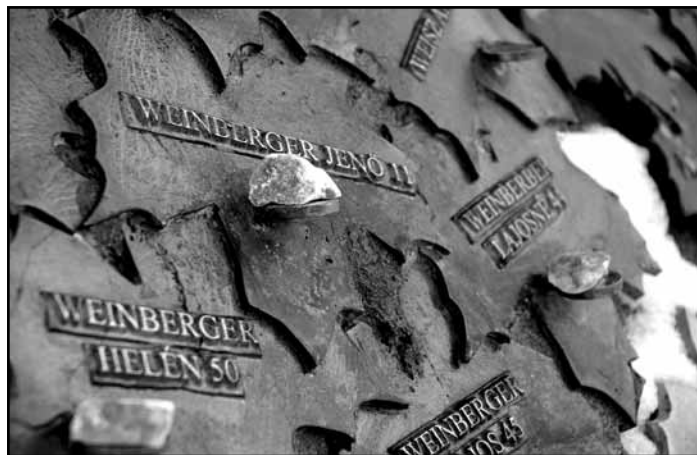
A zsidó áldozatok neve mellé - zsidó szokás szerint - követ lehet helyezni. (Balogh Géza szobrászművész alkotása.)

ronk vagy ismerős, aki ezt jelezte volna az adatgyűjtés során, azoknak a neve nem szerepel e névsorban. (Így azután a névsor - még 6 évtized múltán - sem teljes.)