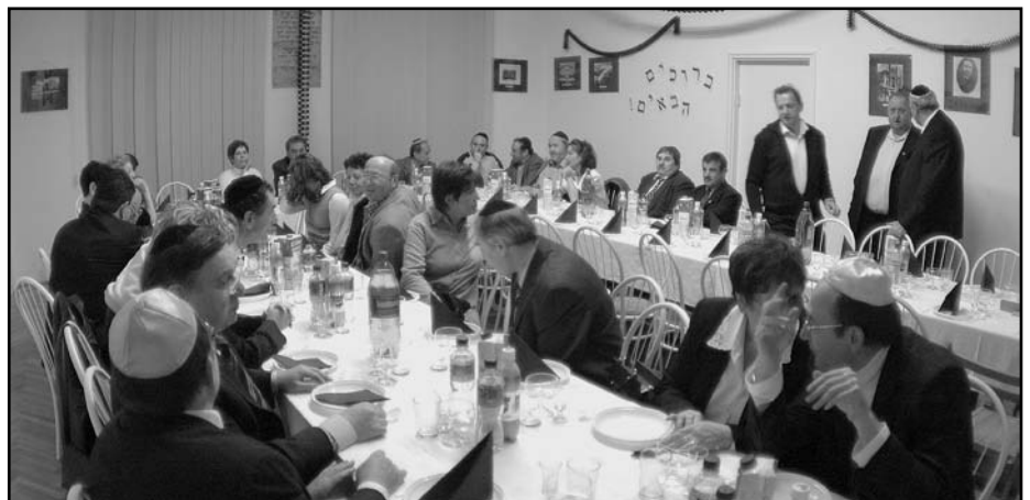
Soá utáni nyíregyházi zsidó „exfiatalok“ 2005-ben. Ismét Nyíregyházán