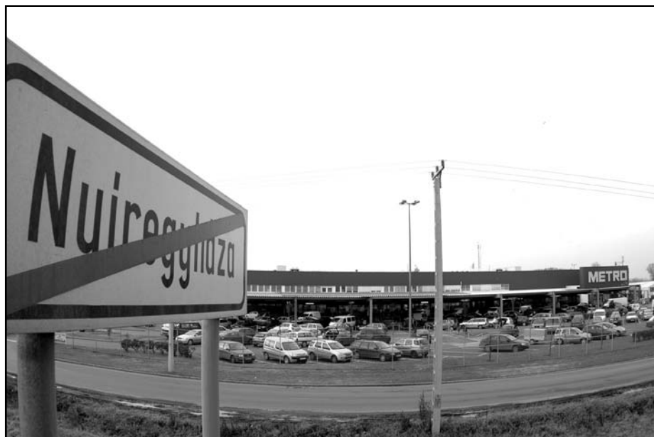
A Debreceni utca vége. Ma is a nagykereskedések fellelvára