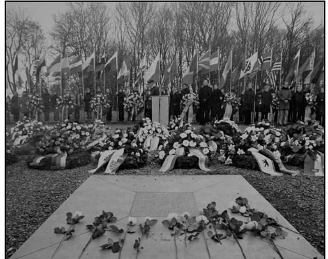
Koszorúzás a buchenwaldi megemlékezésén

„... A nemzetiszocializmus, a háború, a népirtás, és a büntettek idejére való emlékezés nemzeti identitásunk részévé vált. Ebből következik egy maradandó erkölcsi és politikai kötelezettségünk...“ (Gerhard Schröder, 2005.04.10., Weimar)