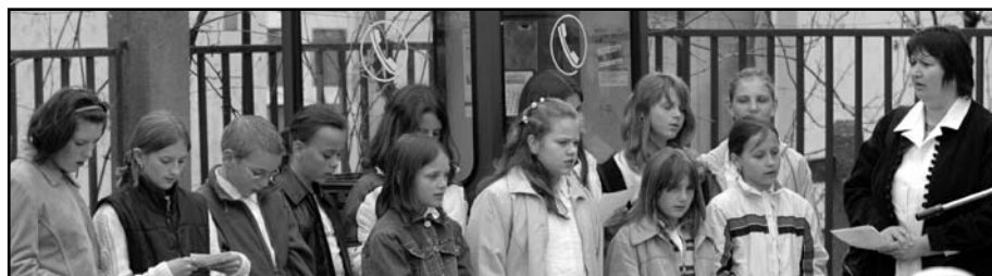
Arany Jeruzsálem... szól a dal Balkányról