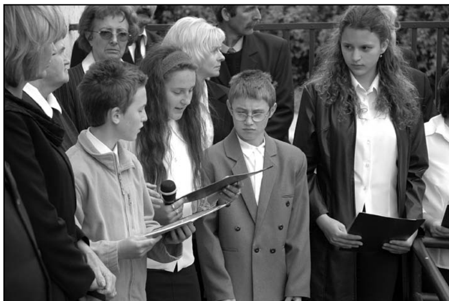
Balkányi gyerekek balkányi gyerekekről emlékeznek...