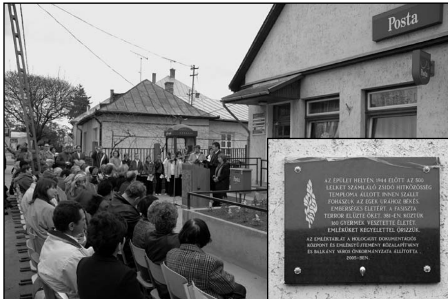
Hol zsinagóga állott, most Postahivatal...

A balkányi holokauszt megemlékezés igen szép gesztus a város lakóitól, melynek polgárőrsége a gépjármű forgalom átirányításával ügyelte az összejövetel nyugalmát.