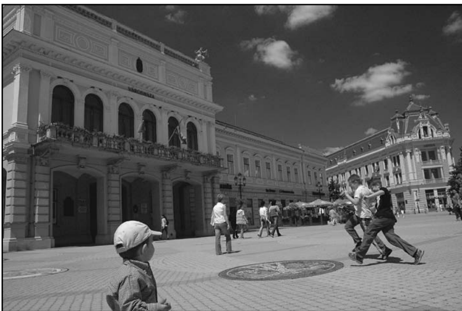
A nyíregyházi Kossuth tér ma, háttérben a Takarékpalotával

Borászattal kapcsolatban Karfunkel Mór és Eisenberger pincészete volt a legjelentősebb. Az előbbinek a pincészete a lovassági laktanya