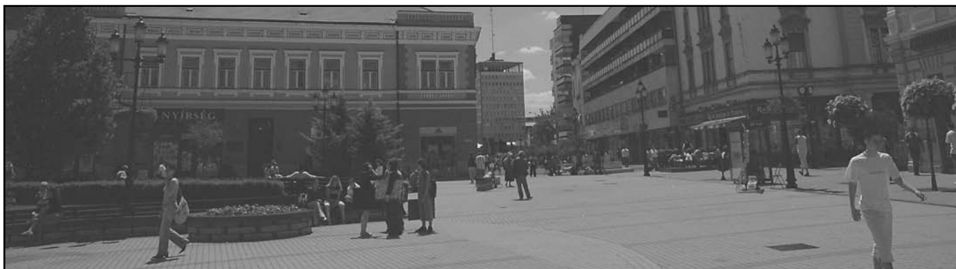
A Zrínyi Ilona utca ma. Valakik hiányoznak...