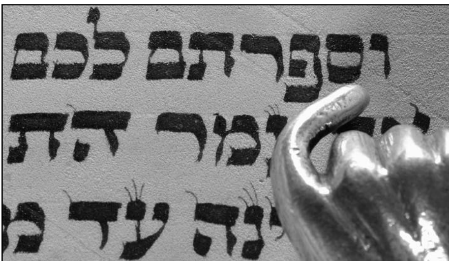
„És számoljatok....“ Részlet a Tórából.

A Tóra egy tökéletes társadalom képét vetíti ki, melyben nincs gonoszság, hanem szeretet, és i-ten-félelem van. Ahhoz azonban, hogy ezt a Tóráat átvegyük és megkapjuk szabadságra van szükségünk. Az egyiptomi szolgák nem lettek volna képesek a Tóráat átvenni és megtartani. Ahhoz, hogy a szabadulás bekövetkezzen, Izraelnek ki kellett vonulnia Micrájimból az Ő-ó parancsa szerint és Mózes vezetésével. A Tóra átvétele és megtartása tehát a szabadságon alapszik, úgy ahogy a két ünnep is egymástól függ.