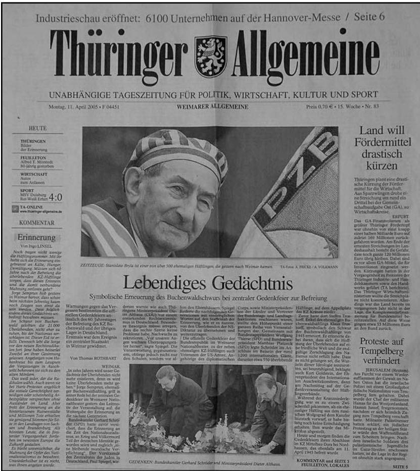
A Thüringer Allgemeine című újság címlapján tudósított a megemlékezésről