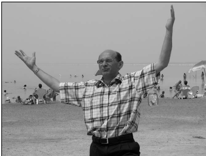
A Holt tengernél: Hát kérem, ez itt az élet!