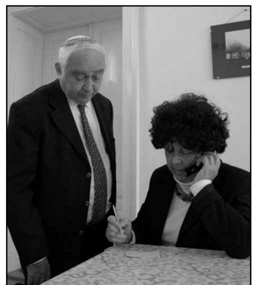
A Friedman házaspár