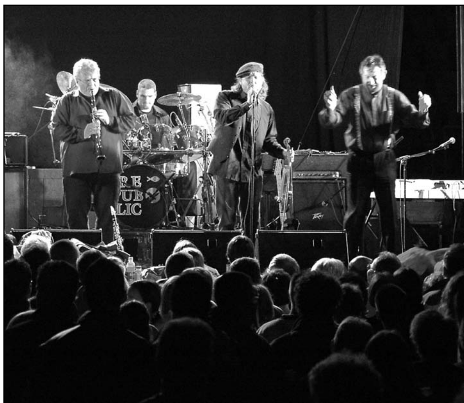
A Budapest Klezmer Band Nyíregyházán

Zsidó kulturális és egyéb rendezvények Nyíregyházán