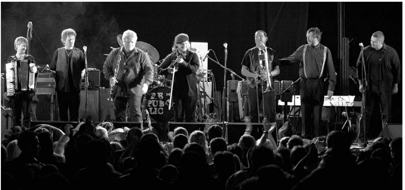
A Budapest Klezmer Band