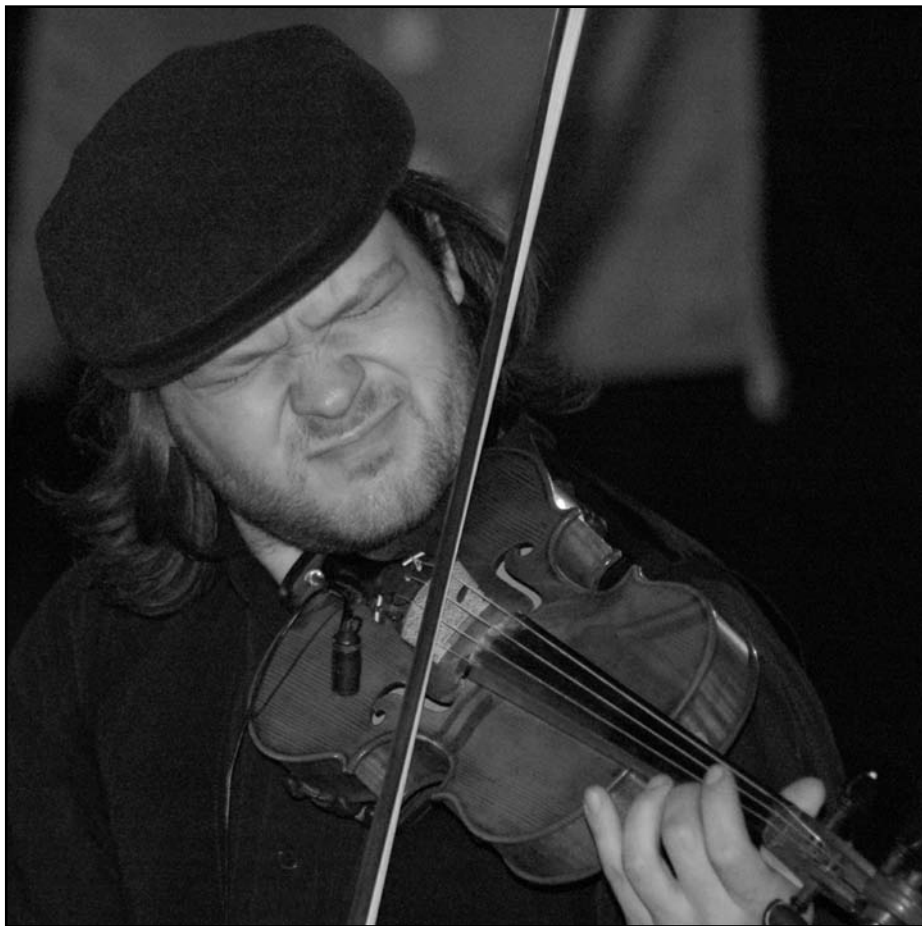
Hadd szóljon a klezmer!