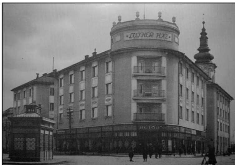
A Luther és a Kállay utca sarka egykor

Meg kell emlékeznünk a Kereskedő Ifjak Egyletéről is. Nyíregyházán nagyszámú zsidó tulajdonban lévő üzlet volt, zömében zsidó vallású segéddel. Ez a réteg a szegényebb kispolgári családokból rekrutálódott. Többségük 4 középiskolát (polgárit) végzett. Általában három éves tanonckodás után (kemény élet volt) kapták a segédlevelet. Jelentős részük művelődni akart, és feljebb emelkedni a társadalmi ranglétrán. Megalapították saját egyesületüket. A