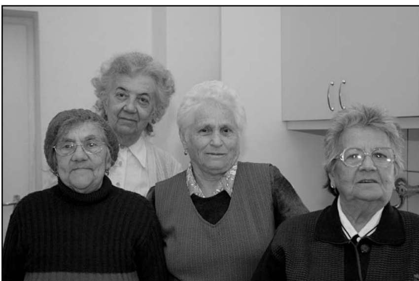
A nyíregyházi Hitközség Nőegyletének vezetői