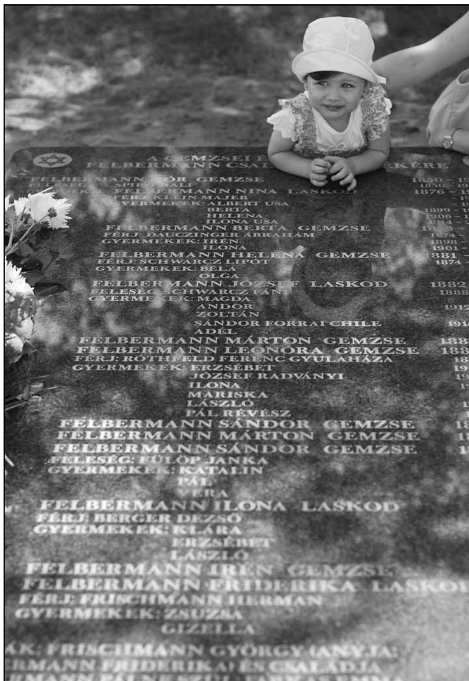
Elődök és utódok