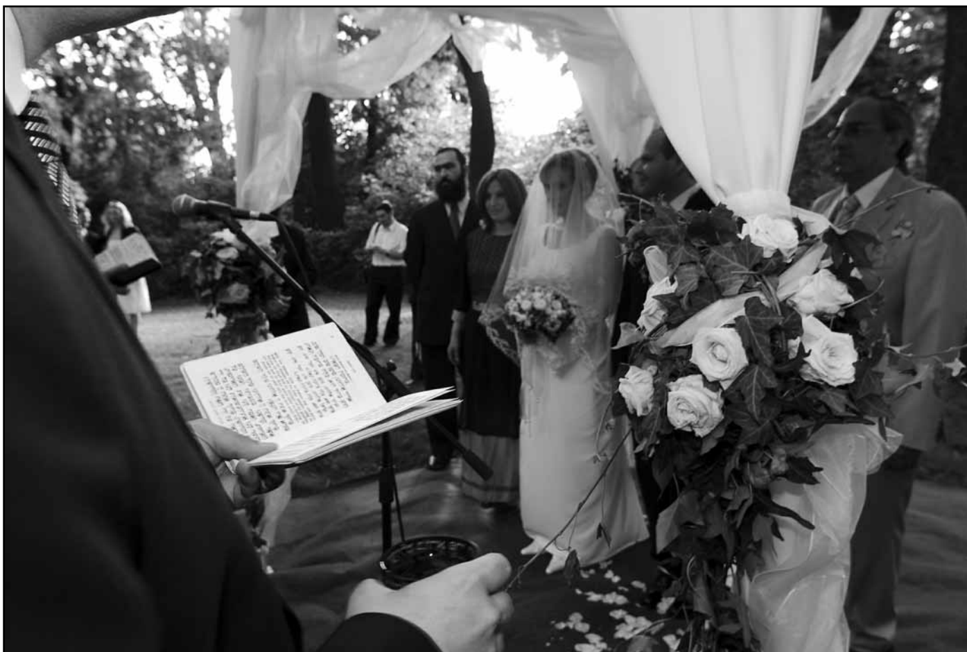
Eljegyzés és áldás...