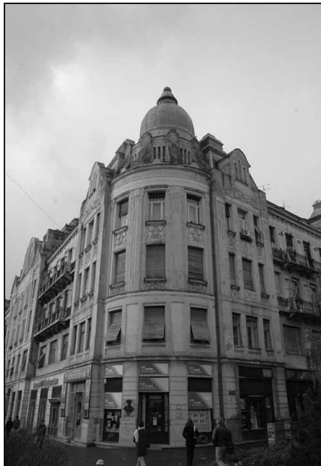
A Nyírvíz palota ma