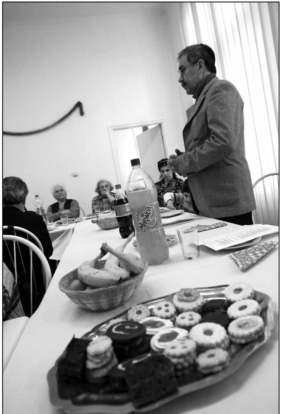
Slachmónesz és piremi gondolatok

a zsidó nép fennmaradásának és elpusztíthatatlanságának jelképét látják. Hámán további megerősítést merített abból, hogy Ádár az akkoriban Niszántól kezdődő év utolsó hónapja volt. Azt nem tudta csak, hogy Izrael vége a kezdete egyben, s hogy „Necách Jiszrael lo jesáker ve'lo jenáchem“, azaz Izraelnek erőssége pedig nem hazudik, és semmit meg nem bán. Ma a zsidó államban ezt valamivel másként mondják: Izraelt csak elpusztítani lehet, legyőzni nem. ■