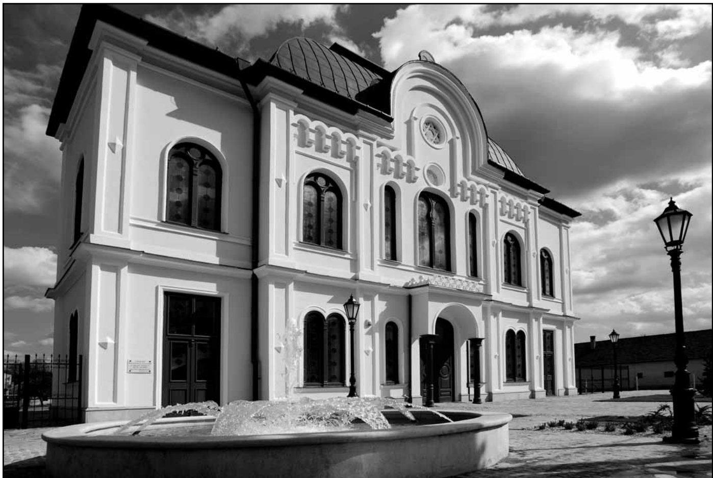
A tokaji zsinagóga régen...