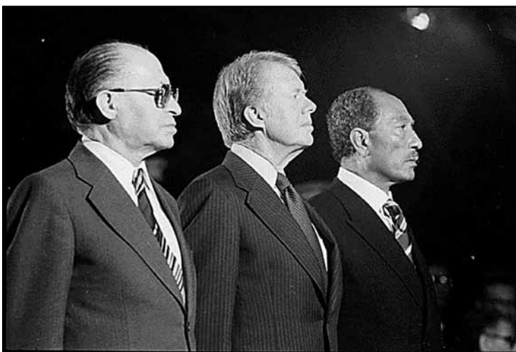
Camp David-ben Jimmy Carter-rel és Anvar Szadat-tal

F 15-ösök kíséretében, melyek célja a támadás fedezése és a radarok megzavarása volt. A célpontig vezető 1100 kilométeres utat a gépek Jordániát déli irányból megkerülve, Szaud-Arábia légterén