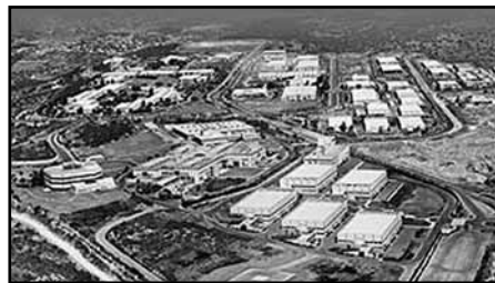
Az Iscar egyik gyártelepe