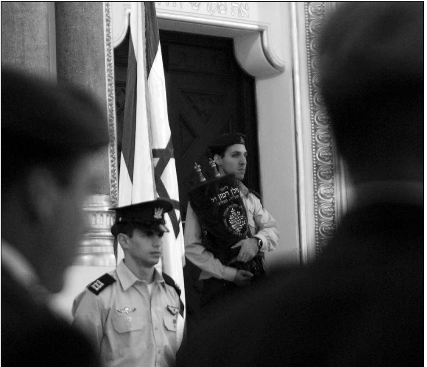
Izraeli katonák a Páva utcai zsinagógában (Cikkünk a következő oldalon.)

TOVÁBBI CIKKEINKBŐL: A délvidéki vérengzés ■ Hegyalja megújult zsinagógája ■ A második nemzedék ■ Tisztelgés Begin emléke előtt ■ Virágzó izraeli gazdaság ■ Ádár havi ünnepek ■