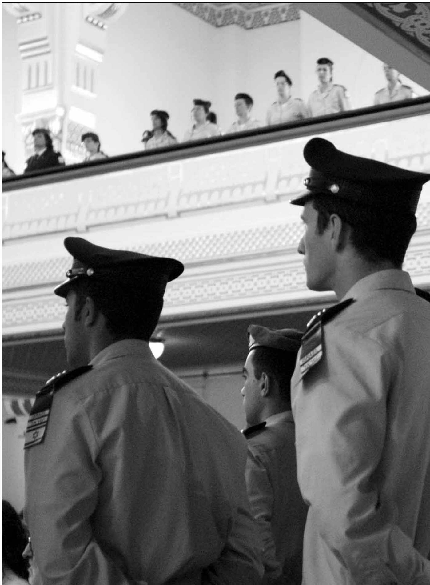
Izrael csak a Soával érthető meg