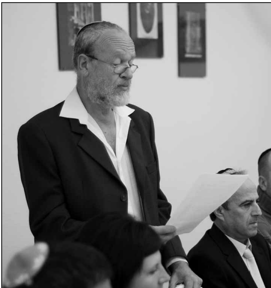
Somos Péter: emlékezés Mózesről, akit mindenki elismer...

Mózes alakja ismert minden monotheista vallásban. Nem érdektelen megjegyezni, hogy a szamaritánusok őt tartják az egyetlen prófétának. Bár