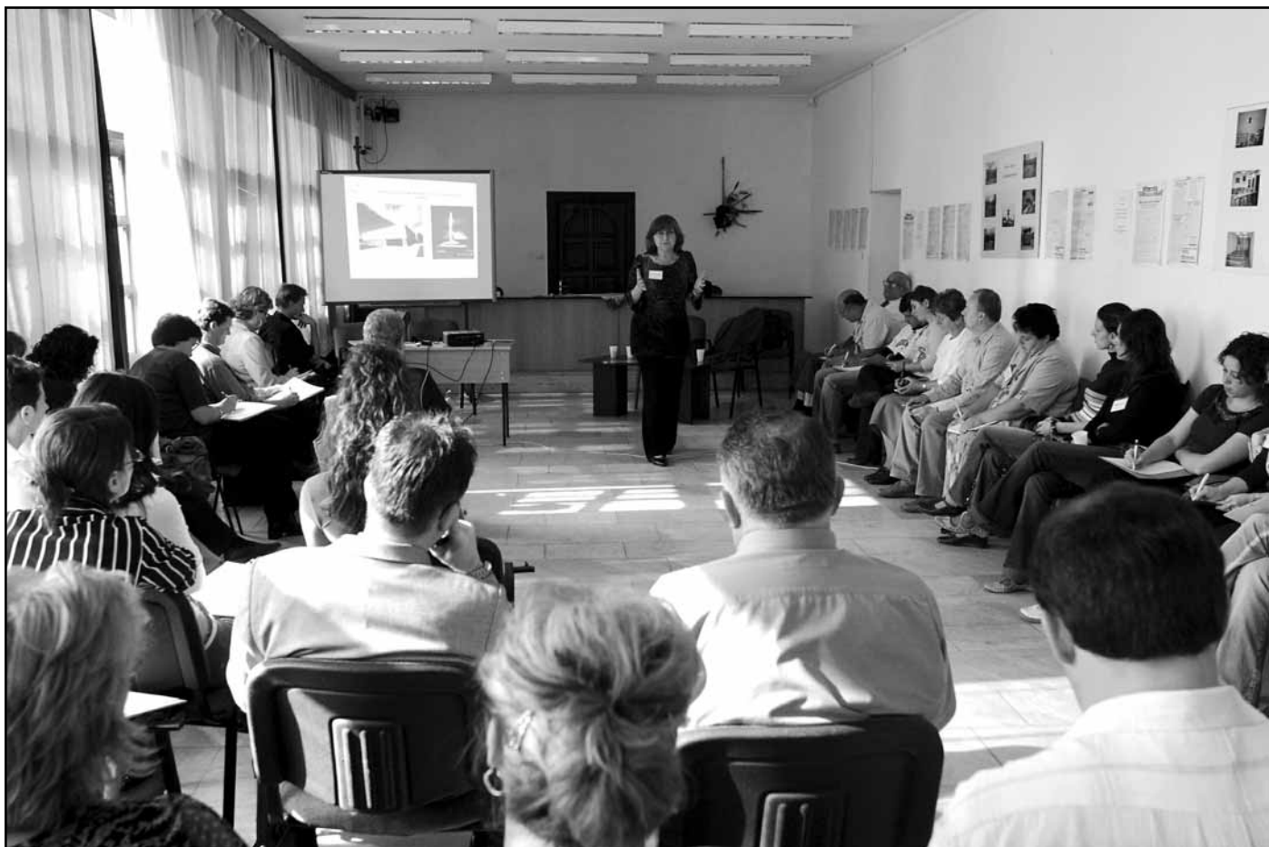
A Soá oktatását oktatni kell

letti, filozófiai és pedagógiai problémára hívta fel a figyelmet. Hangsúlyozta, hogy a Holokauszttal megszakadt az a folyamat, amelyet a felvilágosodás és a francia forradalom hozott. A huszadik századi náci terror következtében az ember történelmi mélypontra került: „az ember bármivé válhat”, emelte ki. Elemezte azt, hogy miképp lett szinte természetes, elfogadott folyamat a zsidóság megsemmisítése az emberek többsége számára abban a korban, miért nem léptek fel ellene. Kiemelte, hogy a zsidóság jogfosztása, gazdasági kirablása, majd megsemmisítése a náci hadigépezet stratégiai terve volt. Több példán ke-