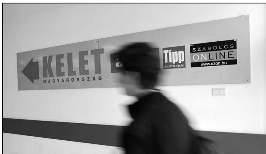
A média irányt mutat.

A Szabolcs Online szerkesztői és operátorai 2006. május 19-étől, a téma megnyitásától 2006. szeptemberéig nem minősítették a hozzászólásokat a Felhasználási feltételek 1. és 2. pontjába ütközőnek, hiszen ebben a témában láthatóan nem korlátozták a felhasználókat felhasználói joguk gyakorlásában.