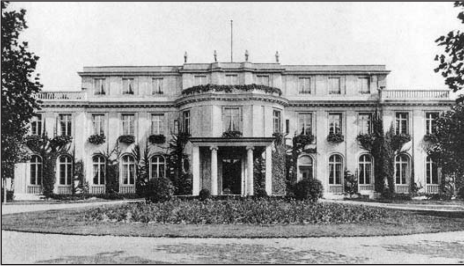
A konferencia helyszíne ma múzeum

megsemmisítő táborokban a tömeges elgázosítás bevezetése, ill. fokozása.