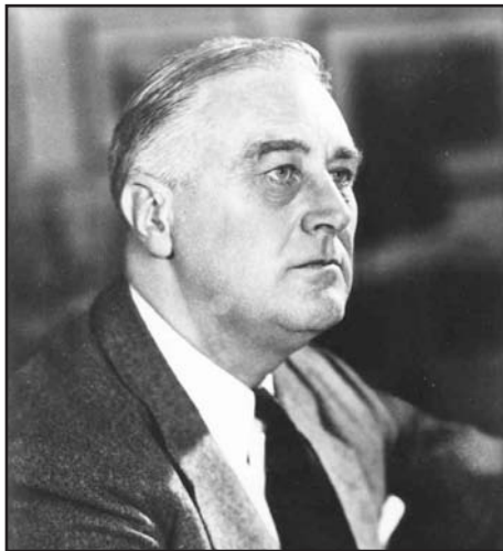
Franklin Delano Roosevelt

zösség Izrael ellen végez kirohanásokat. Hiteléhez méltóan Obama elnök megvétózta az ENSZ-BT Izrael elítélő határozatát, mégis ugyanazzal a lélegzetvétellel a kormány szóvivője, valamint az USA ENSZ nagykövete hangsúlyozták, hogy az Egyesült Államok kormánya egyetért