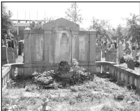
A Burger család síremléke

Bizonyára ma már kevesen tudják, hogy a képen látható, erősen elhanyagolt sírban nyugvó Burger Istvánban kit tisztelhetünk.