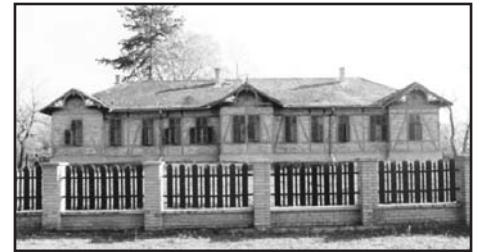
A Szeréna-lak egy régi képeslapon és a bontás előtti állapotában (1997)

szerúsítotték, bővítették a sóstói gyermeknyaralató telepet, az ún. Szeréna lakot” (dr. Margócsy József: Utcák, terek, emléktáblák III. kötetéből)