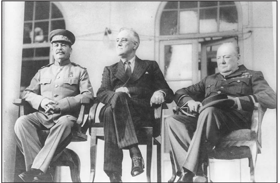
Sztálin, Roosevelt és Churchill

Az amerikai zsidó közösség nagyra becsüli Rooseveltet. Mindig is úgy fognak rá emlékezni, és teljes joggal, hogy ő volt az az elnök, aki