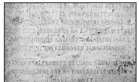
A felirat folytatása

Még talán az kívánczik ide, hogy az ispán bűnösségét az egyértelmű helyzet ismeretében igen enyhén