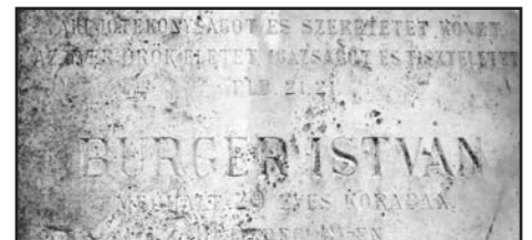
A budakalászi sárga márvány emlékmű felirata