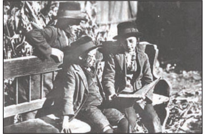
Falusi zsidó gyerekek

nevét, életkorát, születési helyét, a kereset módját, valamint a magaviseletet. Kéken ekkor 16 család lakott, nagyobb részük itt született, de betelepülők is vannak. Jellemzően a környező településekről jöttek, beházasodtak (Vasmegyerről, Ramocsaházáról, Székelyből, Ajakról stb. származtak). Gyerekek száma családonként 2-5 fő körüli. Összesen 54 fő élt a faluban.