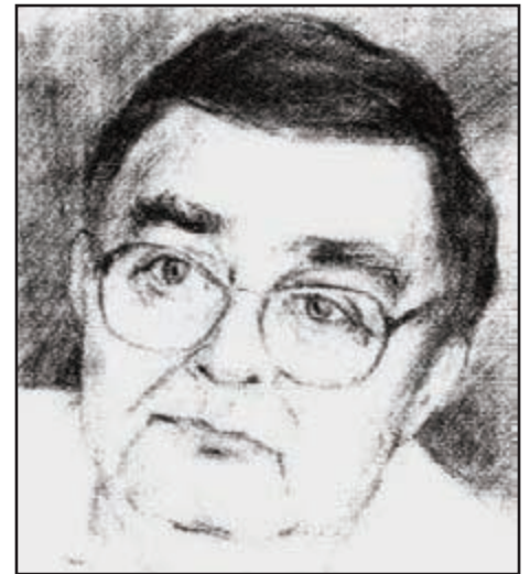
Szabó Tibor grafikája