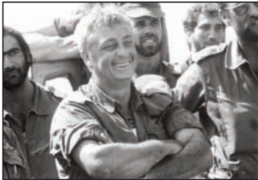
Ariel Saron katonái között a jom kipuri háborúban

Nem szabad megadni az ellenségnek azt az esélyt, hogy meg tudjon bennünket lepni, és egy olyan helyzetbe kényszerítsen minket, ahol kénytelenek vagyunk hasonló, vagy kisebb veszteséget elkönyvelni. Még a mai világban