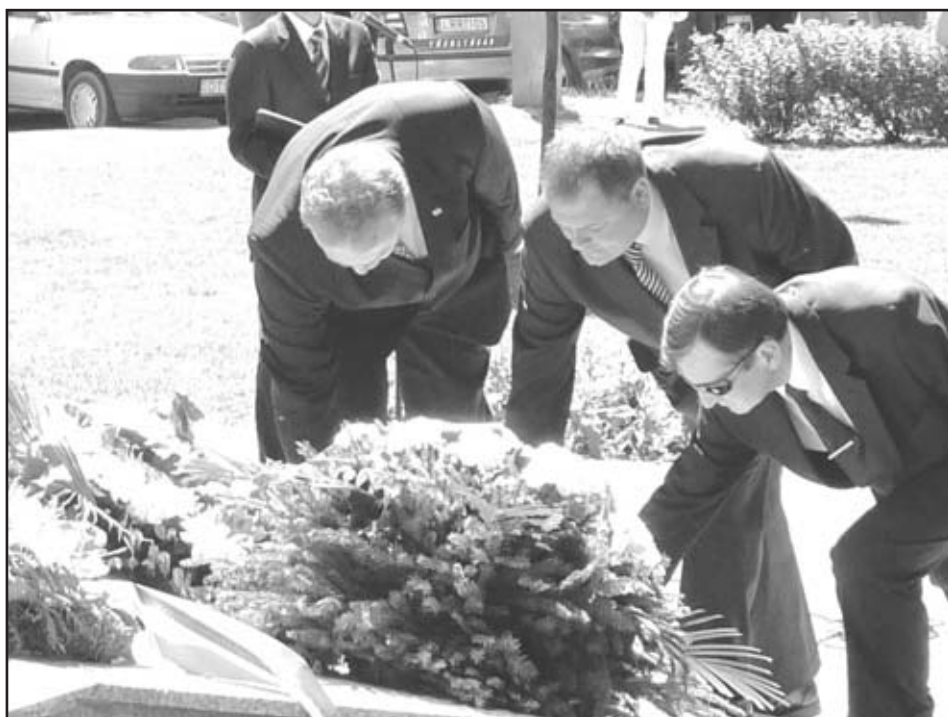
Koszorúzás a városi emlékműnél.