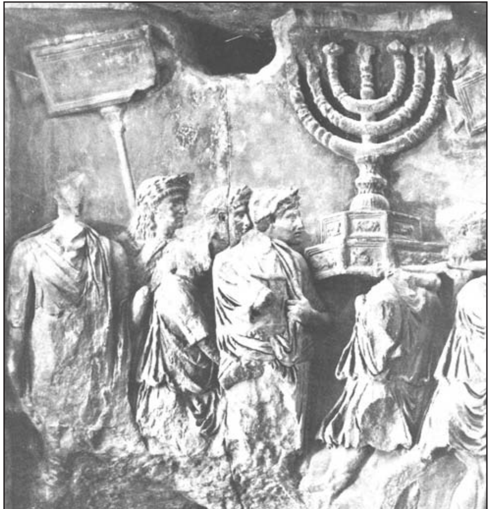
A menóra Titusz diadalívén

A rejtély máig megoldatlan. Egyesek úgy vélik, hogy jobb, ha homály fedi a kőtáblák sorsát, mert előke-rülésük esetén számos bonyodalmat