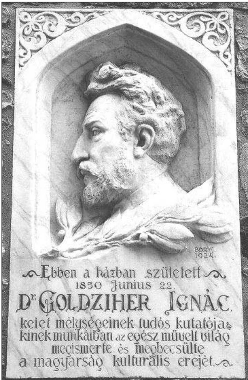
Goldziher Ignác emléktáblája Székesfehérvárott

kivándoroljak. Nincs az a hatalom a világon, amely engem hazámból elvigyen.”