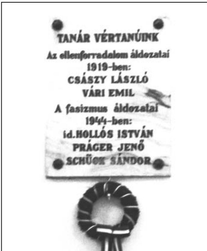
Emléktábla a gimnázium aulájában