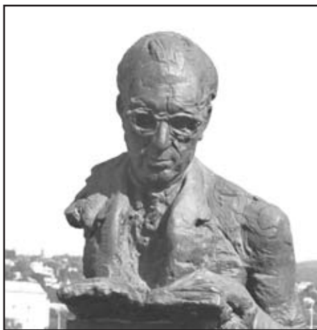
Bibó István szobra

Nem kérdés, hogy a huszadik század és a második világháború tömegével mutatott példát a borzalmakra, melyből különösen Közép- és Kelet-Európában szinte minden népnek kijutott. Azonban Bibó István 5 a maga